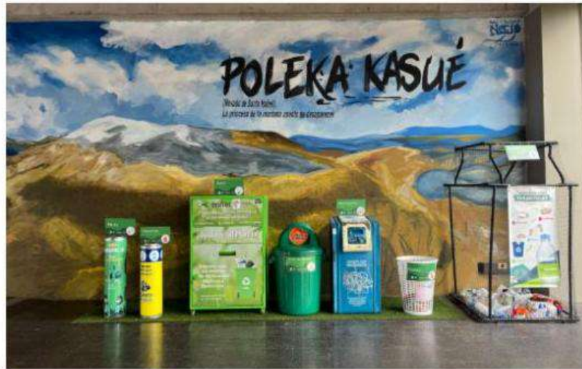
Hall Central de la Universidad de Caldas.