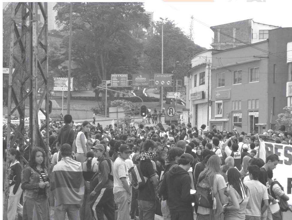
Estudiante U. de Caldas

Es necesario que estos actos y este pedazo de tan triste historia sea recordada, contada y conmemorada, no desde la tristeza, ni desde la desesperanza, si no con un enorme sentido de lucha, de pertenencia y de defensa, porque no