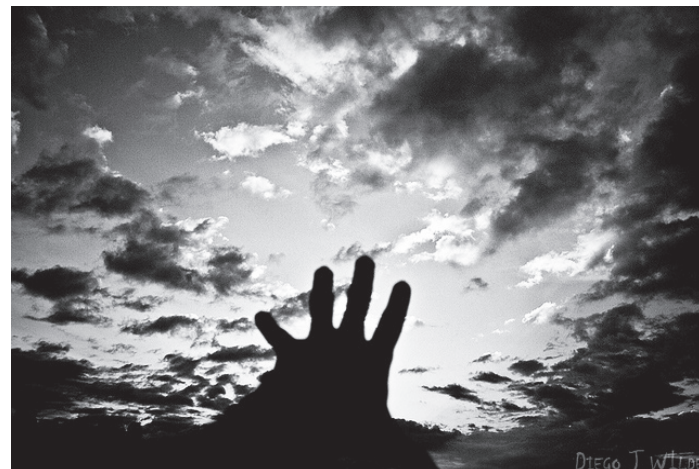
Imagen: En mayo los recuerdos noctámbulos juegan monopolio con cenicienta...

De repente, me empezó a aterrar lo que veía de un modo que no comprendía. Extensos cultivos de dulce que nunca acababan y al fondo una casa de madera de donde salían