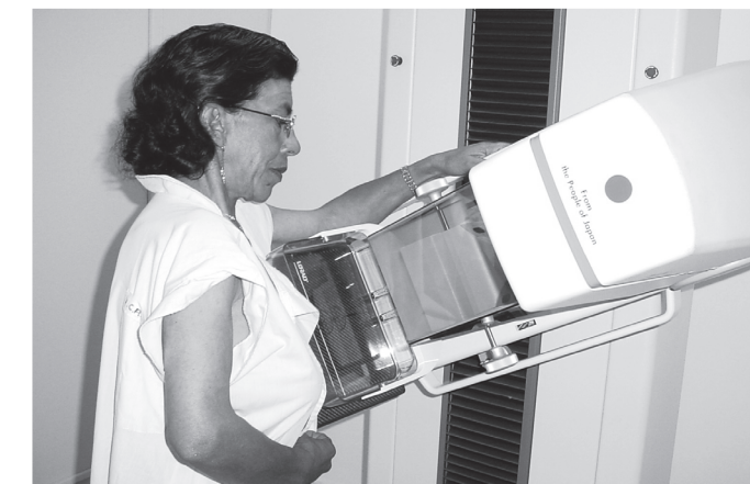
Equipos de análisis de senos del Programa de Cáncer de Cervix.