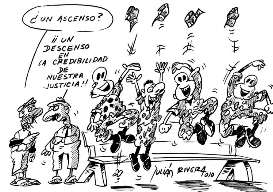
Por vencimiento de terminos quedan libres todos los militares vinculados por falsos positivos

Uribe propone una soplada a cambio de $100.000 mensuales, como también le ofrecía a los militares ascensos y bonificaciones económicas a cambio de resultados representado en capturas y asesinato de guerrilleros ¿cuál fue el resultado?, que la ansiedad de ganar dinero fácil (componente esencial de lo que se denomina la mentalidad mafiosa) llevó a los montajes que hoy conocemos como falsos positivos, que el señalamiento a personas inocentes se convirtió en una constante, que deudas pasionales o de cualquier tipo fueran saldadas mediante la acusación engañosa, ya que lo único que el gobierno busca es obtener números positivos, mostrar resultados, diagramar cifras vacías, así estas sean producto de la falsedad y violación