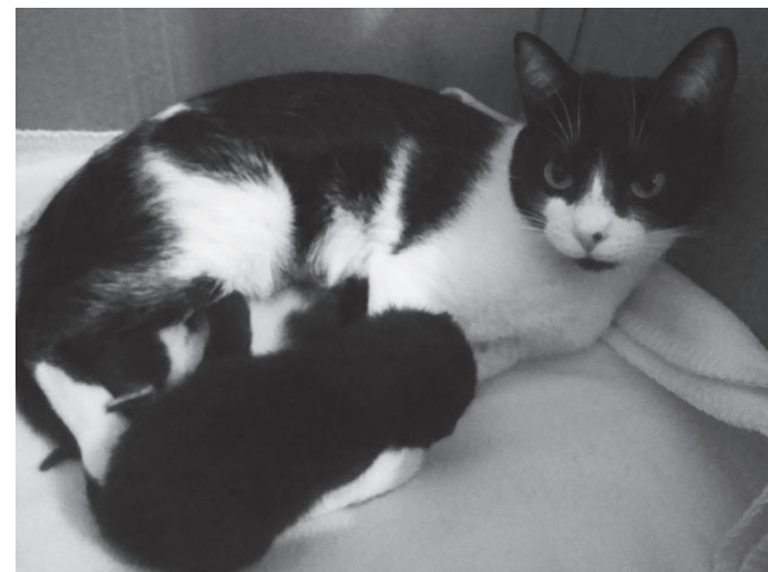
Esta es Terremoto. ahora vive tranquila con sus hijos.