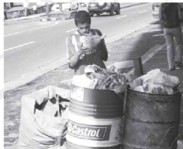
Los Rosales-2007, a una cuadra de la Universidad de Caldas. Grupo de Estudio Trabajo Social Crítico

Hemos caminado largo tiempo buscando el llamado "desarrollo", ante su demora preguntamos cuando llegará, por qué demora... Si deseamos con urgencia nos permita saborear los placeres de la calidad de vida y satisfaga a plenitud nuestras necesidades. O ¿Será que en este instante habita entre nosotros y nosotras haciéndonos saborear los desechos del sistema-mundo-moderno? En su defecto nos encontramos en el camino las profundidades de las canecas de "Castrol" de las cuales recibimos alimento con sabor a desarrollo.